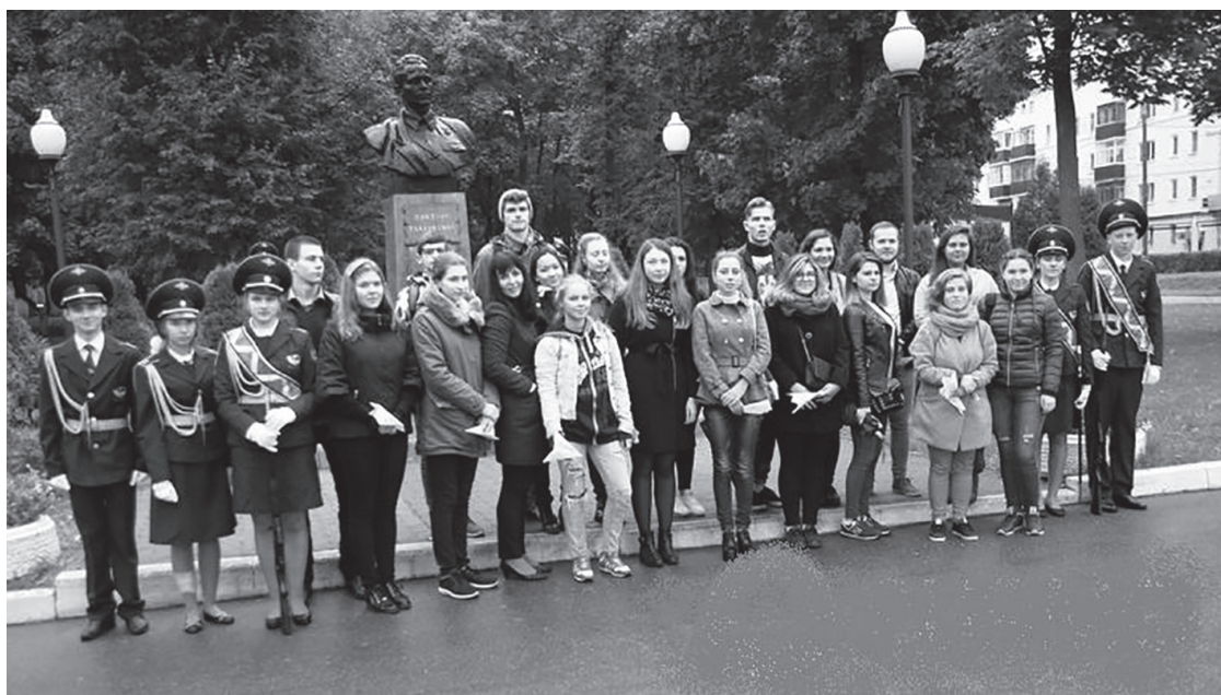
У памятника Герою Советского Союза Виктору Талалихину Московская область, г. Подольск